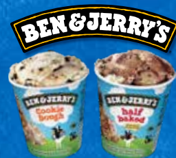
Suomen ostetuin pint-kotipakkaus