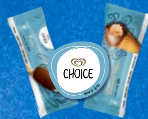
Suosittu erikoisruokavalioon sopivat jäätelöt, kuten maidottomat ja gluteenittomat