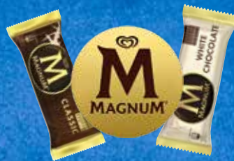
Suomen ostetuin kerta-annosjäätelö