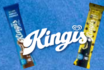
Suurella sydämellä vuodesta 1980. Suomen ostetuin peruspuikkobrändi.