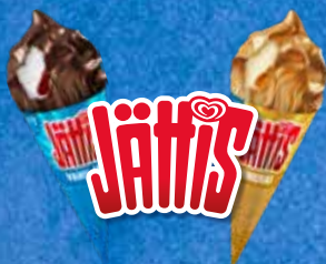
Suomen ostetuin iso tuutti