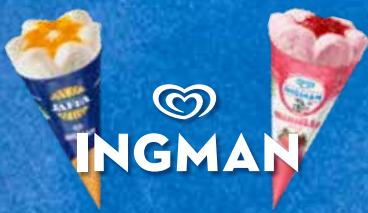
Suomalaista kermajäätelöä Sipoosta!